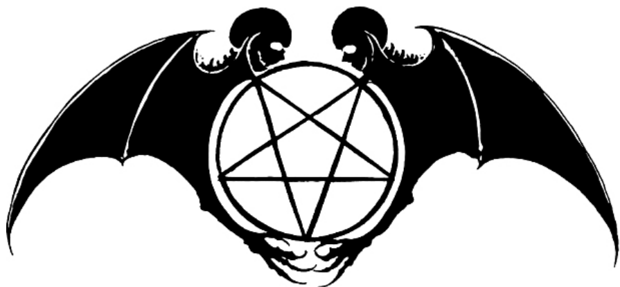
Символ Варколачи Культовые врата Черного Ордена Дракона

Мы пьем из Солнца в полночь, и кровь застывает под бледной луной. Мы пьем из экстаза Клиппот и уходим усиленными и целостными.