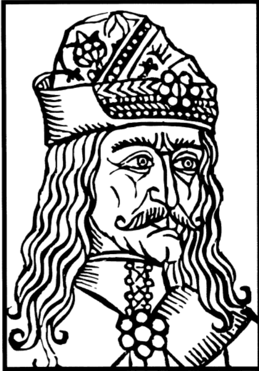
Влад III Цепеш, он же Дракула

Ч то такое вампиризм? Я ответил на этот вопрос в своем первом гримуаре «DRAUGADRÓTTINN: Повелитель Мертвых». Чтобы представить моим читателям второй том, «ШОЛОМАНС: Орден дракона», возникла необходимость еще раз дать определение этой практике.