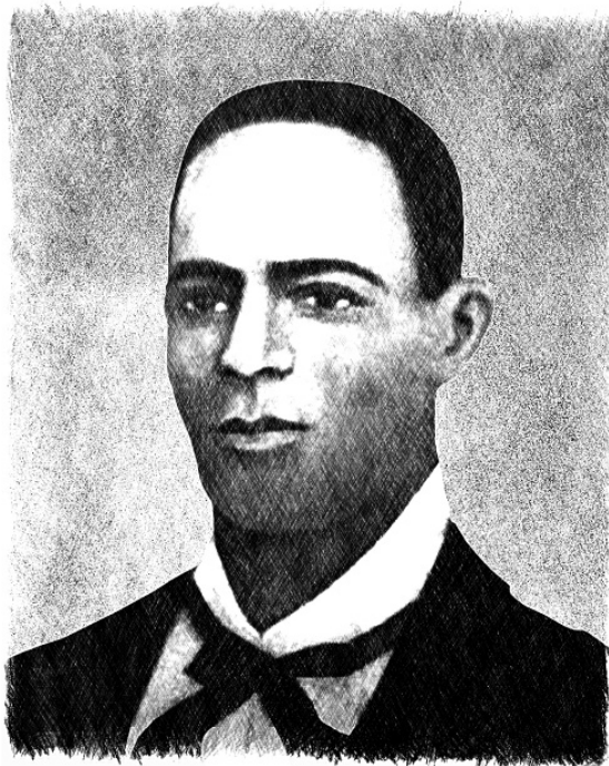
Andrés Facundo Cristo de los Dolores Petit

ту и Калабар. Именно оно дало толчок для распространения религии Пало Майомбе и Пало Кимбиса на Кубе. В тот исторический период Кимбиса преимущественно практиковалось на Гаити, а на Кубе было более распространено Пало Майомбе.