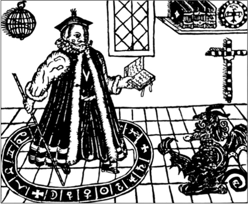
Рис. 1. Доктор Фауст вызывает Мефистофеля

С помощью Мефистофеля Фауст становится весьма популярным волшебником. Он становится известным ещё и благодаря его трюкам в Риме, поражает герцога и герцогиню Ванхольт, предоставляя им виноград в середине зимы и призывая тени мертвых при дворе императора.