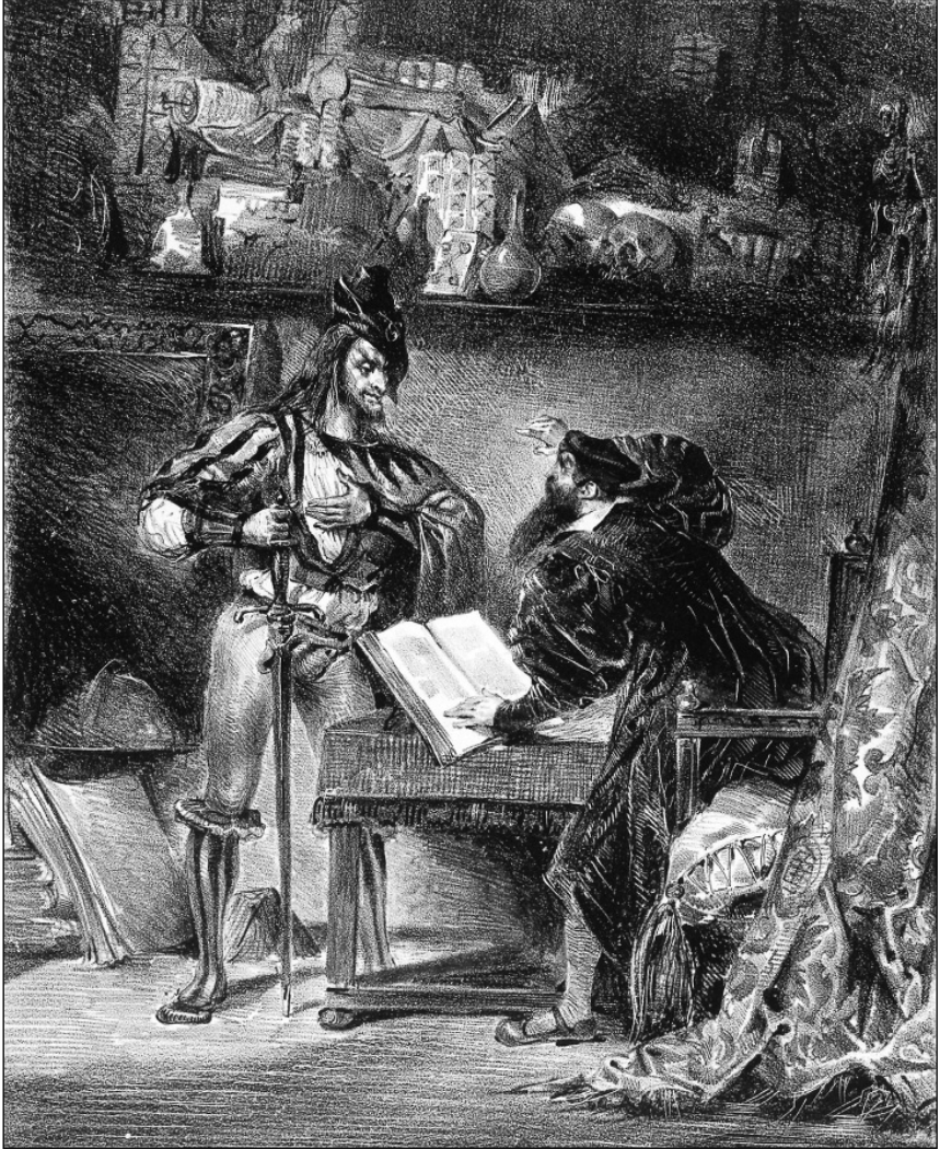
Рис. 2. Эжен Делакруа. Мефистофель предлагает свою помощь Фаусту