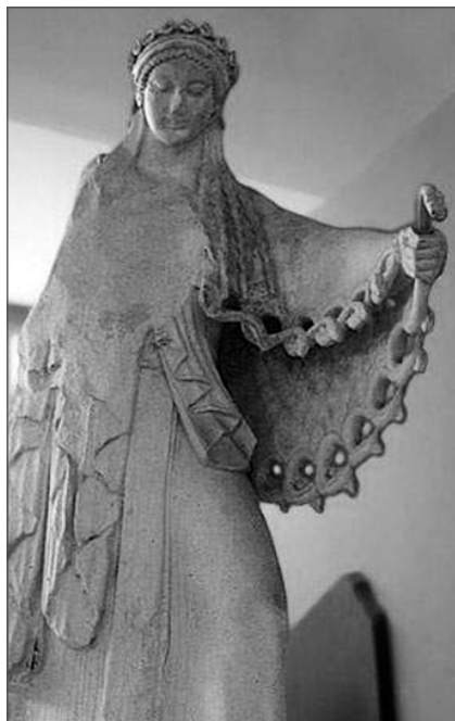
Афина со змеей

разинувши – одна зяпа на зямле, а другая под небеса» (Романов 6, № 27), «оборочуся свиньнёй, один лыч будить рыть у неби, а другой у земле; як их нагоню, то их усих и прожру» (Романов 6, № 29), «А карова-гадина гаворить: «У мяне адин гриб да неба, а другой да зямли: так я наскачу, аднаго схвачу» (Добровольский 1, С. 408), «Заходит облачина 1 и развеваает пасть от самого неба до земли» (Смирнов, № 183).